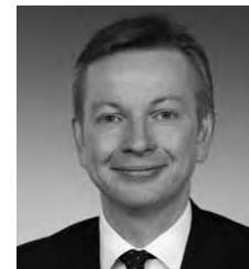
Michael Gove Secretary of State for Education

Termin nadsyłania odpowiedzi do Ministerstwa Oświaty upływa 30 czerwca 2011 r.