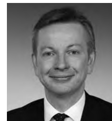
Michael Gove Secretary of State for Education

As respostas terão de ser recebidas pelo Ministério da Educação até 30 de Junho de 2011.